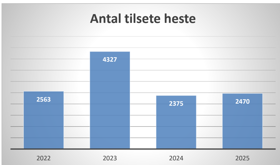
Figur 2 Antal tilsete heste

Hovedparten af de 334 sager er løst af vores 90 frivillige lægfolk. 13 sager har været så alvorlige, at det har krævet hjælp fra en hestedyrlæge, og i 53 sager har vi været nødsaget til at tilkalde politiet, da sagerne har været meget grove, eller ejendomme med dyr er blevet forladt, og vi derfor ikke har haft lovlig adgang. I 10 af de 334 sager blev hestene aflivet.