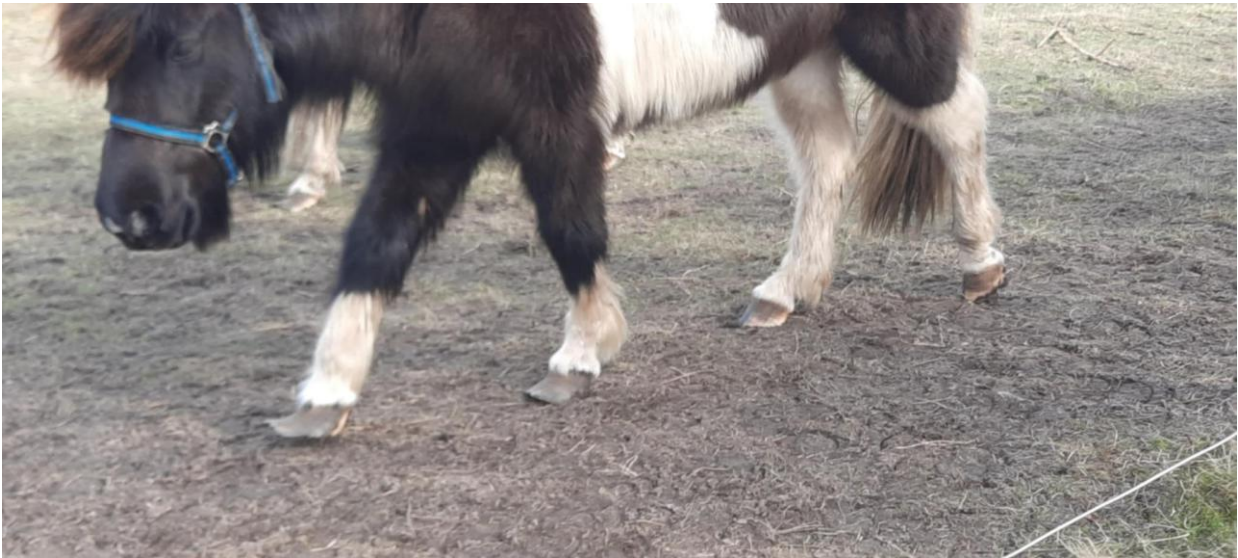
Figur 4 Pony med snabelhove fra en af vores sager

I de sager, hvor det ikke er muligt at bringe forholdene i orden, kontakter vi relevante myndigheder såsom politiet og Fødevarerstyrelsen og beder dem se på sagen. Netop i disse tilfælde er dokumentation ekstra vigtig, da den kan hjælpe myndighederne med at opbygge en sag.