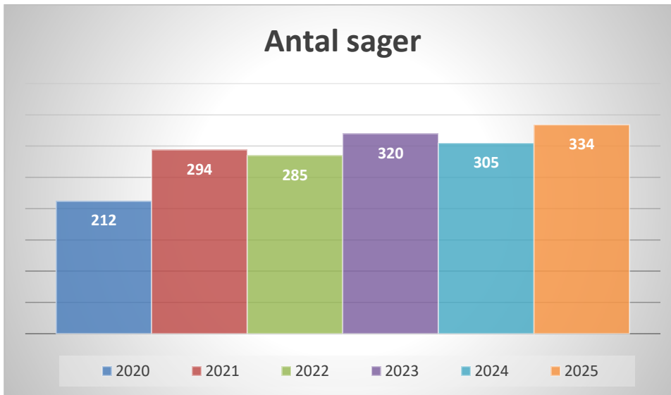
Figur 1 Antal hesteværnsager