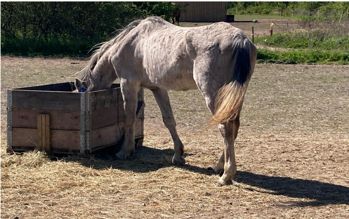
Figur 5 Udmagret hest fra en af vores sager