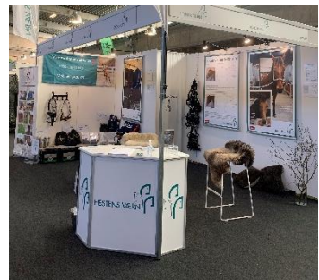
Figur 5 Hestens Værns stand 2024