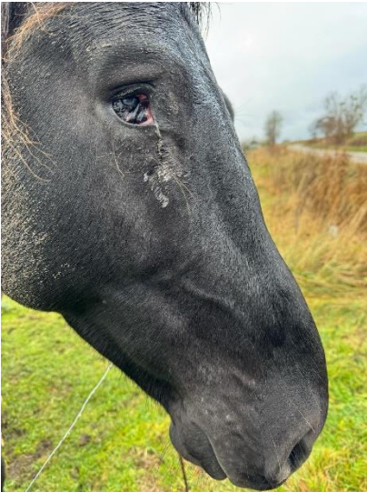
Figur 2 Ældre hest med ødelagt øje

Derudover er vi også afhængige af politiet, når heste står på ubeboede ejendomme, hvor vi ikke har mulighed for at træffe nogen og derfor ikke har adgang eller lovhemmel til at gå ind.