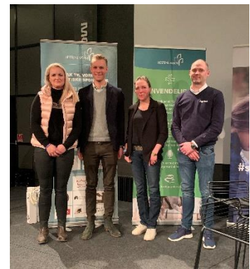
Figur 4 Ekspertpanelet til årets paneldebat

På denne baggrund opretholder Hestens Værn en beslagsmedeliste – et kort over uddannede og registrerede beslagsmede i Danmark, samt en liste over alle nulevende, uddannede beslagsmede i Danmark, som blandt andet kan findes via Hestens Værns hjemmeside. Disse lister og kort opdateres jævnligt. Det er de registrerede beslagsmedes egen opgave at give Hestens Værn besked, når deres oplysninger ændres, så deres kontaktoplysninger kontinuerligt kan opdateres.