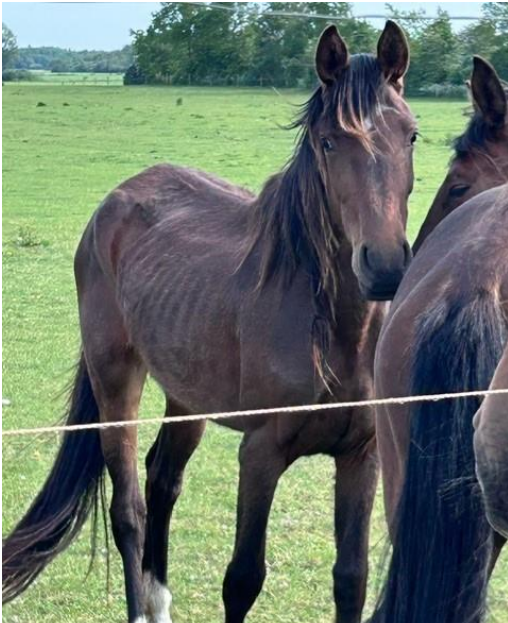
Figur 1 Magre plage fra stort hestehold på Sjælland

Selvom velfærden for heste i sport har været et centralt tema i 2024, er det vanrøgtssagerne, der fylder mest i vores statistik. Det er svært at forstå, at vi i 2024 stadig har problemer med at give vores heste den pleje, de fortjener.