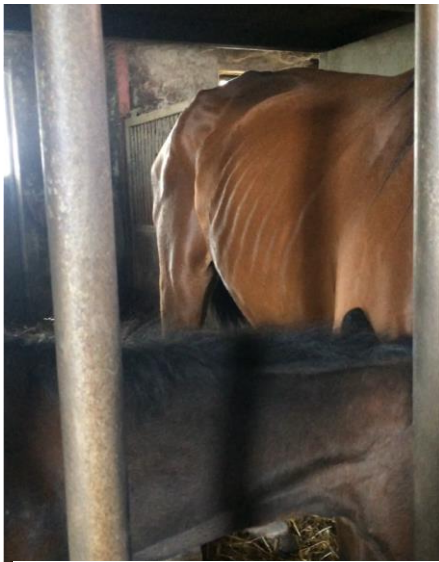
Figur 2