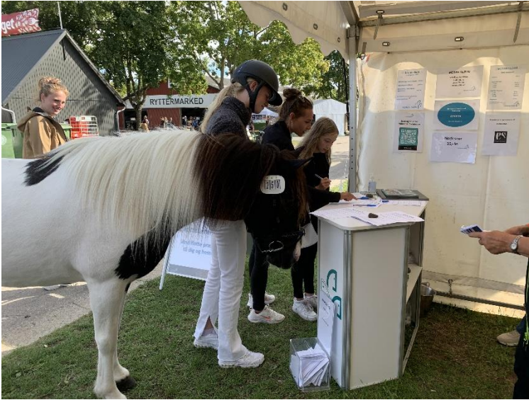
Figur 7 Store Hestedag

Årets konkurrence indbefattede ”luk hesten på fold”, for at understrege, at bevægelse er vigtigt for hestens sundhed ...det foregik med tøjheste og elastikker og mange glade grin og kommentarer.