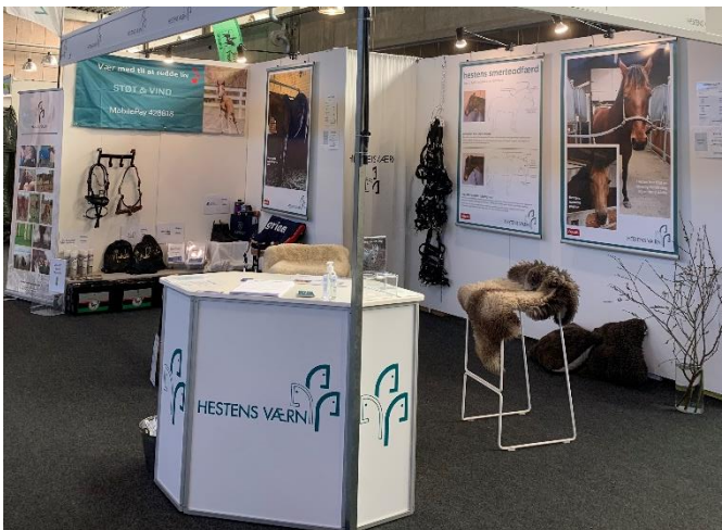
Figur 5 Hestens Værns stand

Hestens Værn var som vanligt repræsenteret i 2023 med en stand på messen Hest & Rytter, og mange deltagere kom forbi til en god hestesnak.