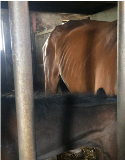
Figur 2