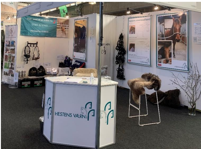
Figur 5 Hestens Værns stand

Hestens Værn var som vanligt repræsenteret i 2023 med en stand på messen Hest & Rytter, og mange deltagere kom forbi til en god hestesnak.