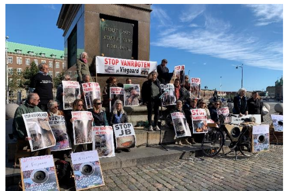
Figur 3 Demonstration foran Christiansborg