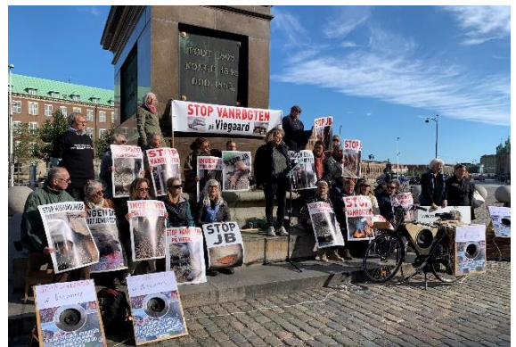
Figur 3 Demonstration foran Christiansborg