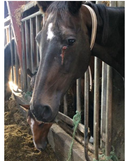
Figur 1: Stutteri Viegård, 2016

heste fra staldene på stutieriet. Sagen blev politianmeldt, men det stod hurtigt klart at myndighederne ikke var meget bevendte - faktisk viser den aktindsigt vi søgte på vores politianmeldelse, at politiet slet ikke tog på tilsyn, men alligevel lukkede sagen efter 4 dage, da de mente at billederne var fra marts og dermed ikke afspejlede det der foregik nu – altså helt UDEN at undersøge, hvordan situationen var på stutieriet. Hestens Værn har gennem 20 år næsten årligt politianmeldt stedet for konkrete sager om vanrøgt, manglende behandling af alvorligt syge dyr, halte heste, magre heste mm. og vi kender alt for godt den reaktion fra myndighederne, hvor man enten afviser sagen eller kun lige ser på den ene hest vi har sendt et billede af og ikke kontrollerer hele besætningen, fordi det er for omfattende da stutieriet har haft op til 700 heste fordelt på 7 eller flere adresser.