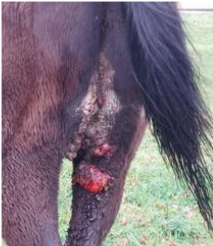
Figur 4 Mager gl. hest hårdt angrebet af sarcoïder, 2023

Udover mishandlingsagerne så har vi også indført en skarpere praksis ved gengangere i vanrøgtssager af alvorligere karakter, hvor vi nu anmelder til politiet fremfor at sende lægmand eller dyrlæge ud for 3 og 4. gang. Det har medvirket til stigningen i antallet af henvendelser til politiet.